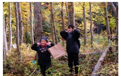
▲五感で自然を感じました

今年のワークショップのテーマは、「ブナの森の大きな地図と小さな地図」。ブナの森を歩きながら見つけた葉っぱや枝、木の実などを観察して、それらを使った地図を作ったり、葉っぱなどの模様をよく観察して隠されている地図を探します。この日は、「大きな地図を作る」ワークショップでした。