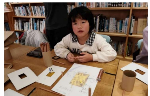
▲自然に隠れた小さな地図を描きました