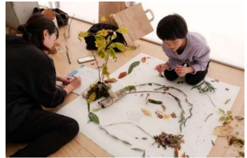
▲自然物を使って大きな地図を作りました

今回のワークショップでは小さなフレームを使ってもらい、森の細部を観察してもらいました。また、その細部から見えてきた小さな地図を想像して描き、自分ではない誰かに伝えることができました。今後、只見町のどこかで2回のワークショップで完成した作品を展示する予定です。詳細はブナセンターのホームページなどでお知らせいたします。