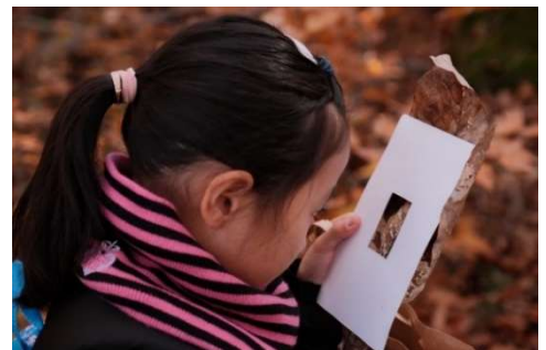
▲フレームで森の細部を観察しました